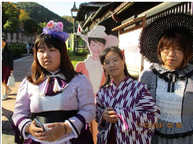
※写真は教会と明治時代の衣装のコスプレです。