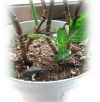
紫陽花の芽が出たよ♪