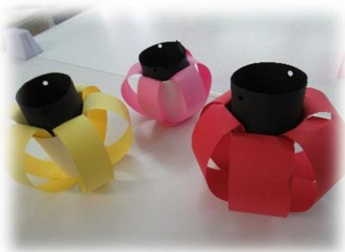
紙コップで作った手作り提灯