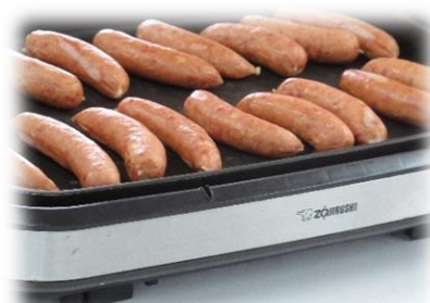
旨味が詰まったフランクフルト